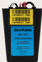
IVM-OUT Gestiona válvulas y dispositivos de otros fabricantes