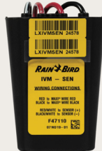
IVM-SEN Controla sensores meteorológicos o de caudal