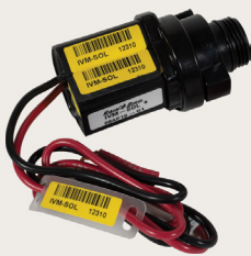
IVM-SOL Controla estaciones o válvulas maestras